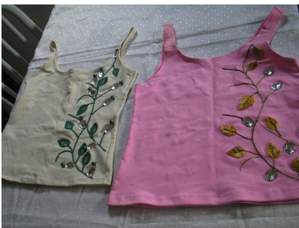
Blusas bordadas com pedrarias e linhas em alto relevo.