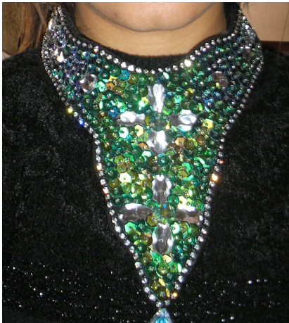
Gargantilha toda bordada em miçangas, pedrarias e paetês.

Adriana não trabalha apenas com material de plástico para montar os colares. Há algumas peças que são montadas com material um pouco mais caro. “Além de eu utilizar as miçangas eu uso estrasse para fazer peças mais sofisticadas, e é mais um motivo para usar o veludo, porque sua aderência não deixa eu perder facilmente os estrasses, perder estas pedrinhas é perder dinheiro,” conta.