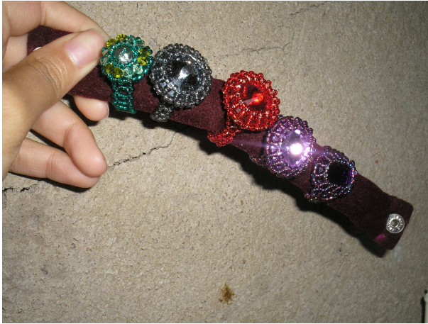
Anéis de miçangas.

Abaixo vemos um pouco mais do trabalho que Adriana faz em casa, além de colares, pulseiras, há também anéis de miçangas onde são anexados pedrarias e lantejoulas de santinhos.