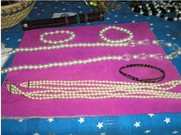
Colares e pulseiras de pérolas