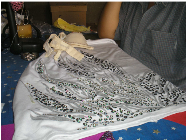
Bordados de com paetês.