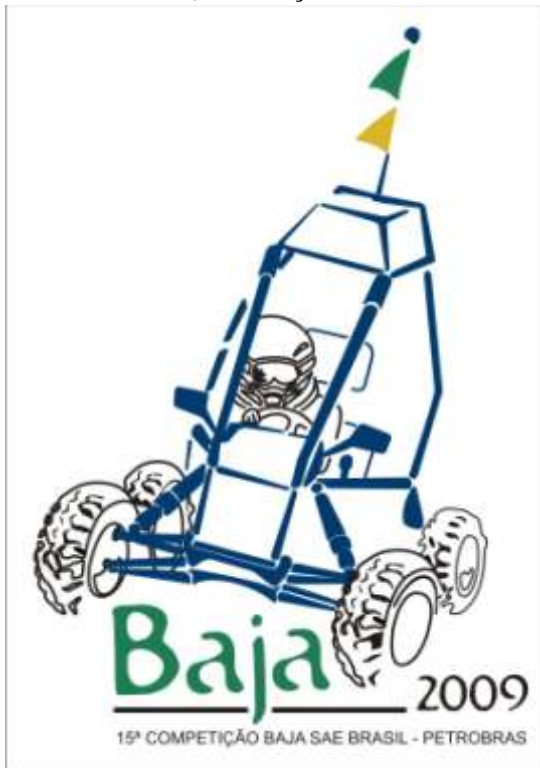
Figura 1. Logomarca Baja SAE

Se tratando de um veículo fora de estrada e com motorização padrão de 10 HP, buscamos a utilização, em todos os sistemas, de materiais leves, resistentes e com boa viabilidade econômica. Respeitando todos os quesitos de segurança exigidos pelo regulamento otimizamos ao máximo a ergonomia e o conforto para o piloto.