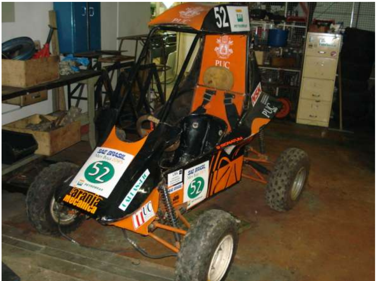
Figura 2. Modelo LM2004

Nossa principal fonte de pesquisa e ponto de partida foi o LM2004, nome dado ao último mini-baja produzido pela PUC-Rio. Analisando os pontos fortes e fracos do projeto anterior foi possível decidir quais pontos seria modificados e quais sistemas seriam mantidos.