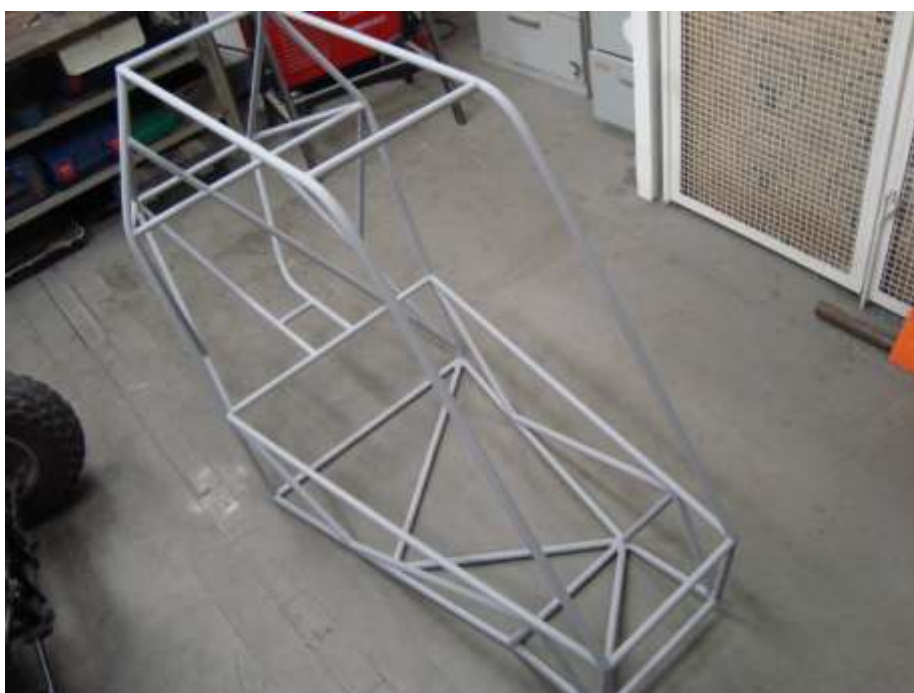
Figura 8. Chassi pronto na oficina