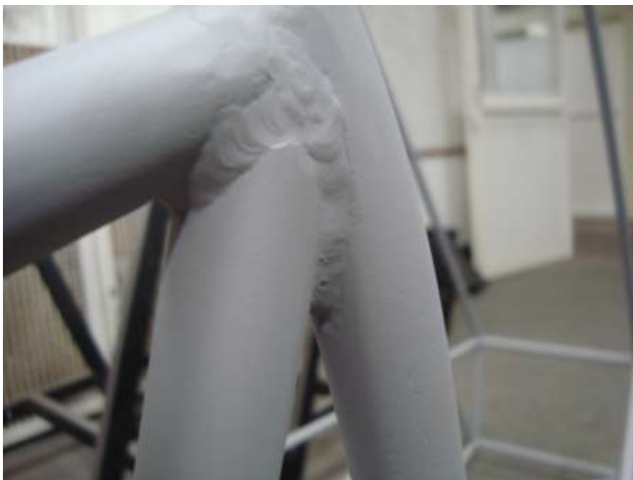
Figura 7. Detalhe da solda TIG