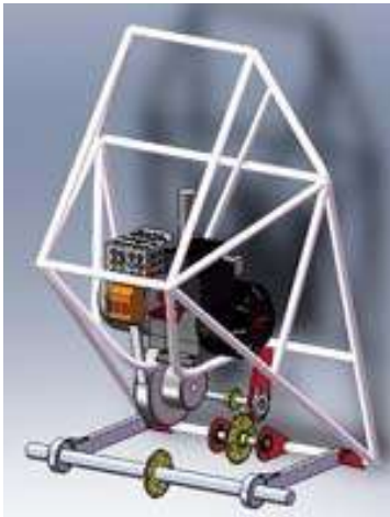
Figura 4. Traseira (eixo rígido e maior espaço para trabalhar)

Baseado principalmente nas regras da competição, o PR2008 começou a ser esboçado no software SolidWorks, e com reuniões semanais a equipe foi fazendo ajustes e o protótipo foi tomando forma.