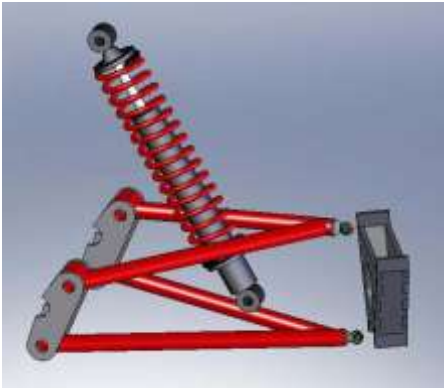
Figura 3. Duplo A

Após conversas com os integrantes da equipe anterior, percebemos que existiram três pontos críticos no LM2004. Além da dificuldade de fazer a manutenção na parte traseira do veículo, o cockpit era apertado, deixando o piloto desconfortável e perdendo pontos na prova que avalia o conforto. Por outro lado, a suspensão dianteira funcionou muito bem, o que nos permitiu utilizar o mesmo modelo, conhecido como “duplo A”.