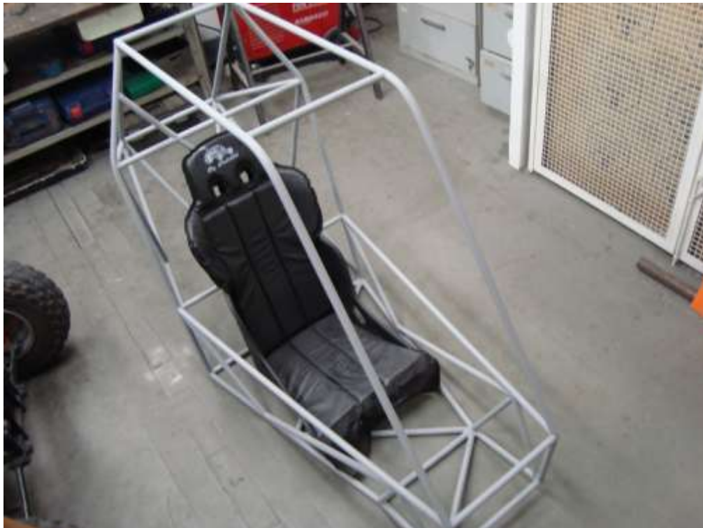
Figura 9. Banco concha, cockpit mais confortável

Todas as etapas do projeto foram documentadas, o que permite que equipes futuras continuem utilizando os programas, tabelas e materiais de auxílio já testados anteriormente.